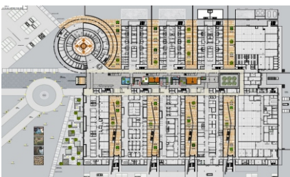
Vue en plan

La situation géographique isolée du projet exige une optimisation rigoureuse de la construction et du fonctionnement, partant du gros oeuvre jusqu'à la technique médicale. La planification des équipements médicaux et techniques doit surtout assurer une haute fiabilité, une maintenance réduite au minimum et une grande autonomie, ceci en maintenant les standards Européens.