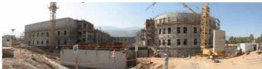
Gros Œuvre entrée principale

L'hôpital avec une capacité de 168 lits se trouve à Blida, une ville à environ 50 km au sud-est d'Alger. Le complexe se divise en deux bâtiments fonctionnels de taille importante, qui hébergent aussi l'administration, et trois autres bâtiments où se trouvent les différents services de soins.