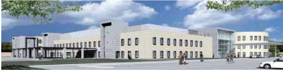
Visualisation entrée principale et urgences