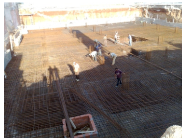
Travaux de fondation

Le radier général forme avec les voiles latérales et la dalle haut sous sol en béton armé un box étanche, appelé « white box », sans avoir recours à l'étanchéité traditionnelle. L'auto-étanchéité est assurée par un radio-ferrailage adéquat permettant de limiter l'épaisseur des microfissures dans le béton à 0,1mm.