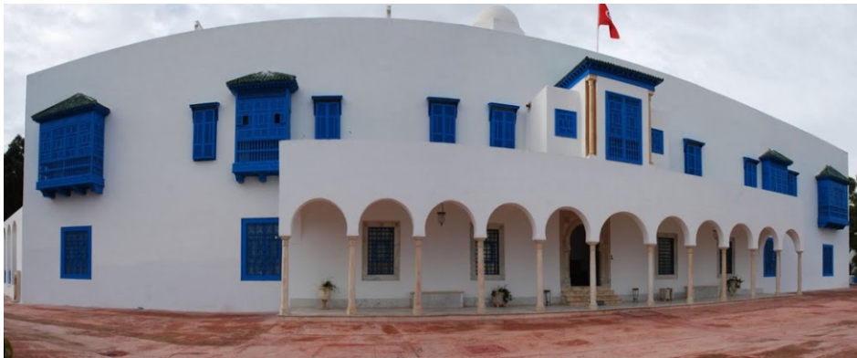
Entrée du palais

Situé à 8, rue du 2 mars 1934 à Sidi Bou Said, le Centre des musiques arabes et méditerranéennes - CMAM - est conçu comme un espace muséal et d'animation consacré au patrimoine musical tunisien, arabe et méditerranéen. Le CMAM a élu domicile dans le prestigieux Palais Ennejma Ezzahra. Cette demeure patricienne a été construite par le baron Rodolphe d'Erlanger entre 1912 et 1922, en contrebas du célèbre village de Sidi Bou Saïd, à 17 km au nord de Tunis. Peintre d'inspiration orientaliste et grand musicologue, le baron d'Erlanger est surtout connu pour son remarquable oeuvre musicologique intitulée «La Musique Arabe», ouvrage de référence comprenant six tomes de précieuses recherches.